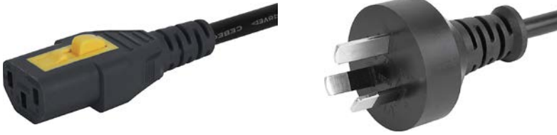
Netzstecker Australien schwarz

AU Anschlussleitung mit IEC Gerätesteckdose C13, V-Lock, gerade